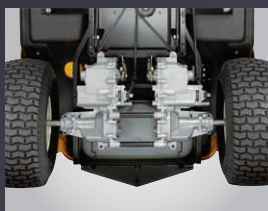
DOUBLE TRANSMISSION HYDROSTATIQUE