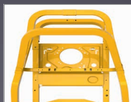
CHÂSSIS TUBULAIRE 50X50 MM